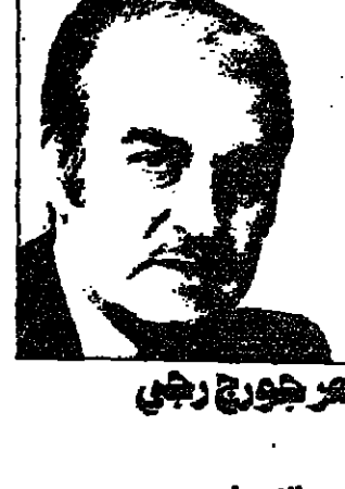
شعر هورج رجي